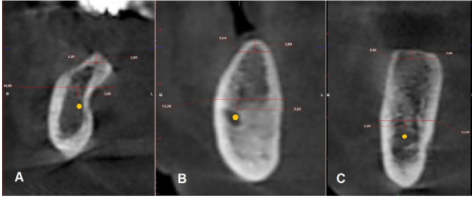
Resim 2. (A) U tipi, (B) C tipi ve (C) P tipi kret olmak üzere farklı hastalara ait çapraz kesit KIBT görüntüleri. Bu görüntülerdeki sarı nokta: mandibular kanalı, beyaz ok: mandibular kanalın 2 mm üzerindeki referans çizgisini, siyah ok: alveolar kret tepesinin 2 mm altındaki referans çizgisini göstermektedir.

2 mm üzerinden mandibula alt sınırına paralel, lingual ve bukkal korteksin dış sınırına uzanan bukko-lingual hat çizildi. Bu çizginin üzerindeki bölgede alveolar kret yukarıya doğru bukko-lingual olarak genişleyip lingual tarafta belirgin bir noktada, sonradan andırkat oluşturduğunda 'U' tipi olarak sınıflandırıldı (Resim 2A). Andırkat olmayan görüntüler de kendi içinde iki tipe ayrıldı. Mandibular kanalın 2 mm üzerindeki bölgede alveolar kret yukarıya doğru daralarak devam ediyorsa 'C' tipi (Resim 2B), alveolar kretin bukkal ve lingual tarafı birbirine paralel seyrediyorsa 'P' tipi (Resim 2C) olarak sınıflandırıldı. 12