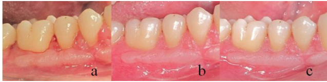
Resim 5. Operasyondan (a) 2 hafta, (b) 6 hafta, (c) 6 ay sonra.