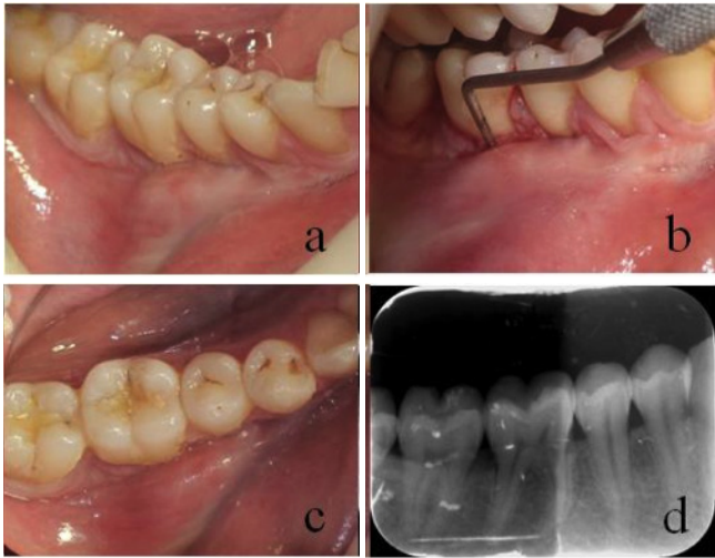
Resim 1. (a) Periodontal apsenin vestibülden görüntüsü, (b) Periodontal apsenin periodontal sonda ile muayenesi, (c) Periodontal apsenin okluzalden görüntüsü, (d) Bölgenin radyografik görüntüsü.

Marmara Üniversitesi Diş Hekimliği Fakültesi Periodontoloji Anabilim Dalı'na alt sağ bölgede ağrı ve şişlik şikayetiyle başvuran 24 yaşındaki sistemik olarak sağlıklı kadın hastanın alınan anamnezinde ilgili bölgeden 2.5 yıl önce cerrahi periodontal tedavi gördüğü öğrenildi. Klinik muayenede bölgedeki 46 nolu dişin alveol mukozasının ödemli, kırmızı, düz ve parlak yüzeyli olduğu ve dişin vestibül yüzeyinde keratinize yapışık dişetin bulunmadığı tespit edildi. Hasta, 46 nolu dişte yatay perküsyonda hafif rahatsızlık hissetti ve diş termal teste normal cevap verdi. 46 nolu dişin mezial kökünün vestibülünde 12 mm sondalama derinliği (SD) tespit edilirken apsenin sondalama esnasında drene olduğu gözlemlendi (Resim 1 a, b, c). Radyolojik olarak herhangi bir patoloji saptanmayan (Resim 1d) lezyona akut periodontal apse teşhisi konuldu.