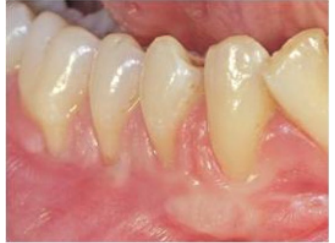
Resim 2. Başlangıç periodontal tedavi sonrası bölgenin ağız içi görüntüsü.

3 hafta uygulandı (Resim 2). İlgili bölgede keratinize yapışık dişeti yetersizliği nedeniyle BPT sonrası 45 ve 46 nolu dişlerin