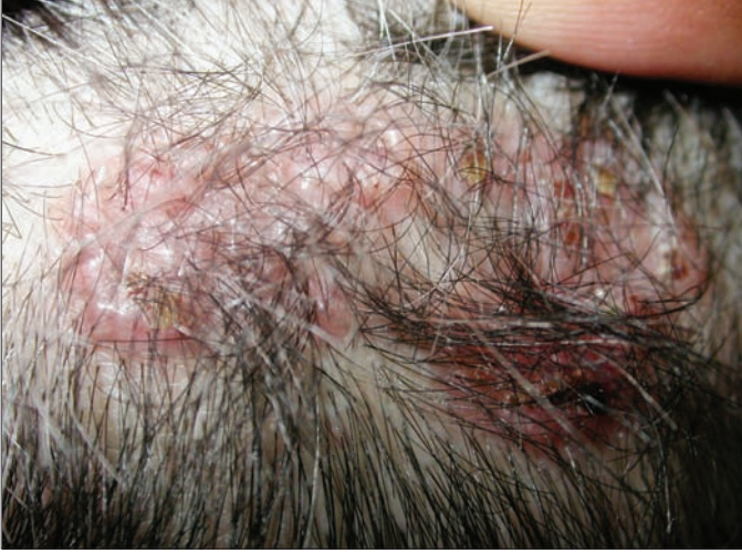
Resim 1. Saçlı deride sağ pariyetal alanda eritemli plak

dokuda, epitelin bir alanda dermis içine doğru uzanan tümöral yapı oluşturduğu izlendi. Ayrıca bazaloid hücre kümelerinden oluşan tümör adacıklarının en dışında bulunan hücre kümelerinin palizadik dizilimi dikkati çekti (Şekil 2). Hastaya mev-