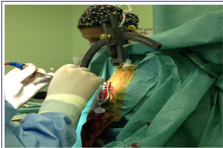
Resim 1. Stereotaktik çerçeve

Sonuç olarak stereotaktik nöroşirurjik girişim ile biyopsi, cerrahi açıdan bir çok avantajı beraberinde getirmektedir. Bununla beraber anestezi yönetiminde de komplikasyonların erken tanınması ve tedavisi, hemodinamik parametrelerin regülasyonu, ayrıca çerçeve nedeniyle hava yoluna ulaşma gücü dikkat edilmesi gereken noktalardır.