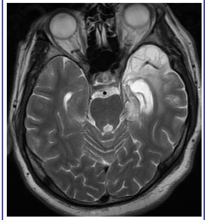
Resim 3. Bir başka hastada kronik dönemde mevcut olan sol temporal lobda atrofi, ensefalomalazik değişiklikler ve ventrikülde genişleme