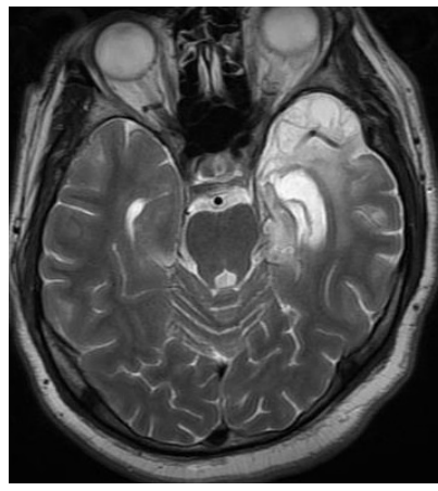
Resim 2. DWI sekansda başka bir hastada solda temporal lobda kortikal diffüzyon kısıtlaması alanları