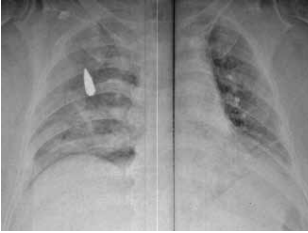
Şekil 1. Ameliyat öncesi akciğerde mermi çekirdeği.