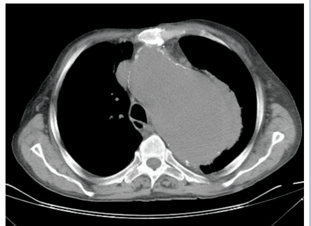
Şekil 2. Kontrastlı toraks bilgisayarlı tomografide sadece arkusu tutan, çapı arkus düzeyinde 120 mm'ye ulaşan, lateralde heterojen görünümde kalsifik olmayan aterom plakları ve periferinde hematoma uyan değişiklikleri olan aort anevrizması.