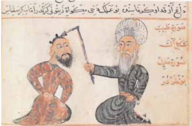
Şekil 2. Epilepside dağlama tedavisi

"Sara balgamdan olursa sakinleştirici kullan (eğer hasta büyük ise ilaç kullanmaya uygun olursa). Eğer hasta küçük çocuksa ona gargara otları ver, onu çiğneyip suyunu yutsun. Eğer rahatlamazsa hastanın başının ortasını dağla, bir dağ ense ve 2 dağ boynuz yerine vurasın, eğer dayanırsa 3 dağ boyun omurgasına, 4 dağ da arka omurgasına vurasın" (Şekil 2).