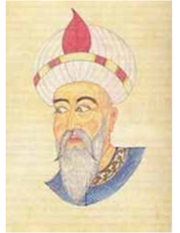
Şekil 1. Sabuncuoğlu Şerefeddin