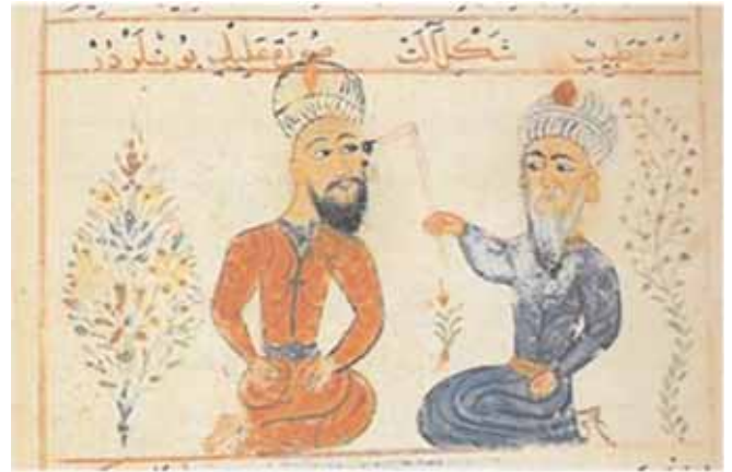
Şekil 3. Başağrısında dağlama tedavisi

-Hastanın şakaklarındaki saç kesesin, atardamarı bulasın, kanın akış hareketi doğrultusunda (ama soğukta bazı kişilerde bulamazsın) o zaman hastanın başını bir bezle bağla ve o bölgeye bez sür ya da su dök ki damar görülsün. O zaman neşteri al..." (Şekil 3).