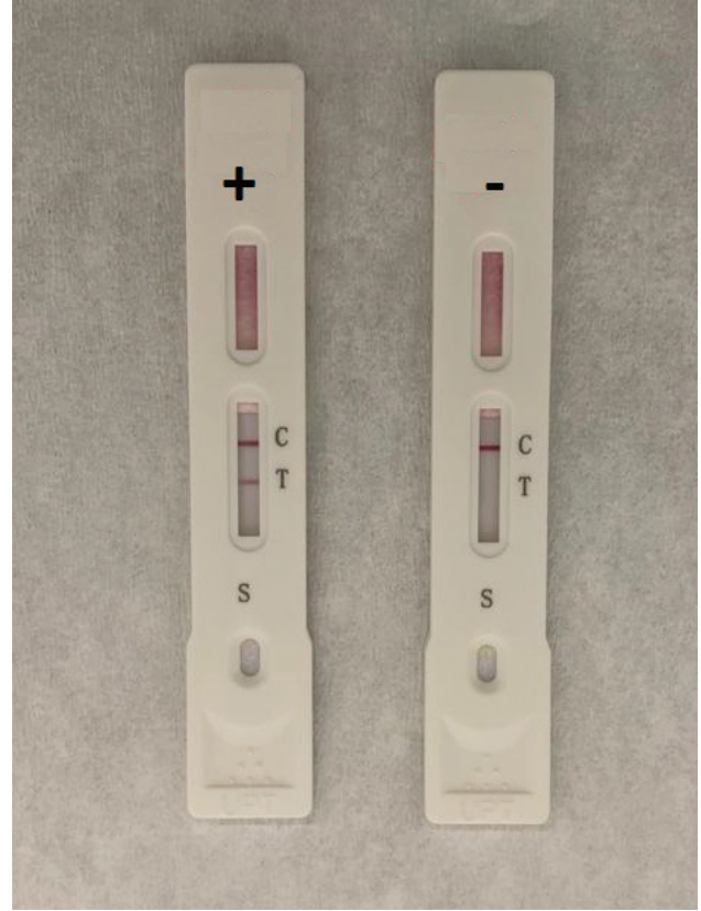
Şekil 3. İmmünokromatografik yöntem ile anti-SARS-CoV-2 total antikorun gösterilmesi. (+) işaretli olan hem kontrol hem de total antikor çizgisinde tutulum olduğu için pozitif hasta. (-) işaretli olan sadece kontrol çizgisinde tutulum olduğu için negatif hasta.

İmmünokromatografik test yöntemi ise özel cihazlar gerektirmediği için tanı kapasitesi düşük sağlık kurumlarında tercih edilmektedir. Test süresi oldukça kısadır ve örnek alımı kan numuneleri ile çalışıldığı için daha düşük risklidir. Özellikle semptomların başlamasından bir hafta sonra, yüksek duyarlılığa sahiptir (32) (Şekil 3).