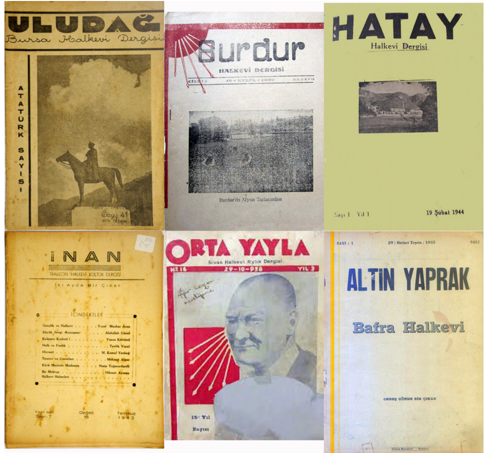
Resim: 1 1930'lu ve 1940'lı yıllara ait çeşitli Halkevi dergileri.

1936'da kurulan Ankara Üniversitesi, Dil, Tarih Coğrafya Fakültesi yanı sıra, özellikle 1932'de kurulan Halkevleri yerel düzeyde tarih ve kültür mirası bilincine çok önemli katkılarda bulunmuşlardır (Akkaya 2014, 4). Akademik kurumların bilimsel-akademik yayınları yanısıra, bölgelerindeki tarihi eserlerin envanterini çıkarmak, bunları sergilemek ve araştırmacıların hizmetine sunmakla da görevlendirilmiş olan Halkevleri ayrıca belge değerinde de bir çok yayın faaliyeti gerçekleştirirler (Doğan 2014, 28). Öyle ki, 1932'den 1955 yılına kadar Halkevleri tarafından yerel tarih, arkeoloji ve kültür mirası alanlarında bir çok telif ve tercüme kitap yanı sıra kendi yayınladıkları dergilerde de çok sayıda makale yayınlanmıştır (Akkaya 2014, 5-19). Halkevleri yayınlarının en önemli katkılarından biri kültür varlıklarını koruma düşüncesinin henüz olgunlaşmadığı bir dönemde bu görüşü savunması ve yayması olmuştur (Akkaya 2014, 17). Dokuz esas şubesinden biri