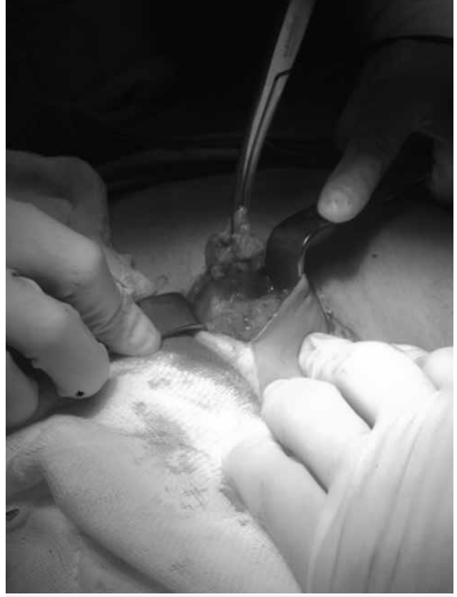
Resim-1: Kitleye, genel anestezi altında 1 cm'lik temiz cerrahi sınırla birlikte total eksizyon yapıldı ve patolojik incelemeye gönderildi.

Otuz yedi yaşında, gravida 3, para 1, abortus 2 olan hasta eski sezaryen skarının sağ üst bölgesinde yaklaşık 1 yıldır olan ve giderek büyüyen ele gelen ağrılı şişlik yakınması ile başvurdu. Hasta ağrının özellikle menstrüasyon dönemlerinde arttığını ifade ediyordu. Hastanın anamnezinden 5 yıl önce geçirdiği sezaryen ameliyatı olduğu, pelvik endometriozis öyküsü ve başka bir hastalığı olmadığı öğrenildi. Fizik muayenesinde; sezaryen insizyon skarının sağ üst kenarında, palpe edilen, cilt altı yerleşmiş, yaklaşık 3x3 cm boyutlarında, sert ağrılı kitle tespit edildi. Hastanın jinekolojik muayenesinde uterus ve overler normal idi. Diğer sistem muayeneleri normal izlendi. Batın öndüvarı yüzeysel ultrasonografik değerlendirilmesinde 29x29 mm çapında, düzensiz sınırlı, heterojen görümlü, kanlanması olan solid lezyon izlendi. Hastanın laboratuvar testleri normaldi. Olgudan pelvik manyetik rezonans görüntüleme (MRG) istendi. MRG, pelvis sağ anterior duvarında yaklaşık 1.5x2 cm boyutlarında kontrast tutulumu gösteren, transvers fasyayı içine alan, posteriorda rektus ve oblik kaslar geçiş noktasında kasların fasyası ile ilişkilenen ancak invazyon oluşturmayan lezyon izlenmiştir şeklinde rapor edildi ve histopatolojik inceleme önerildi. Kitleye, genel anestezi altında 1 cm'lik temiz cerrahi sınırla birlikte total eksizyon yapıldı ve patolojik incelemeye gönderildi