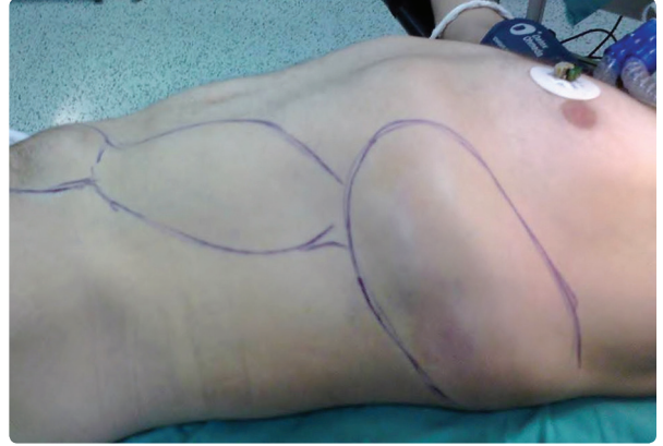
Şekil 2. Operasyon sahasında, solda toraks posterolateralden batın lateralini takip edip sol anterolateralde pubik hatta dek inen koleksiyon görülmektedir. Renkli şekil derginin online sayısında görülebilir ( www.keahdergi.com ).

ulaşan ve küçük kalsifikasyonlar ile orta kesimde hava habbecikleri içeren koleksiyon görülmüş. Toraks bilgisayarlı tomografi (BT) ile değerlendirilmesi önerilen hastanın BT'sinde, sol hemitoraks alt bölge, karın sol üst kadranda alt kostalar seviyesinde anterolateralde cilt altında ve kosta posteriorunda yumuşak doku şişlikleri ve yumuşak doku içerisinde yer yer hava dansiteleri görülmüş, lezyon bu haliyle spesifik edilememiş olup üst abdominal manyetik rezonans görüntüleme (MR) istenmiş (Şekil 1a). Manyetik rezonans görüntülemede karın sol üst kadranda lateralde ve anteriorda en geniş yerinde yaklaşık 6.5x17x17 cm boyutlara ulaşan multiloküle postkontrast periferde kapsüller boyanma gösteren içerisinde yer yer hava intensitelerinin de izlendiği sol üst kadranda abdominal kaslar ve rektus kası içerisinde karın içerisine doğru da lobülasyon