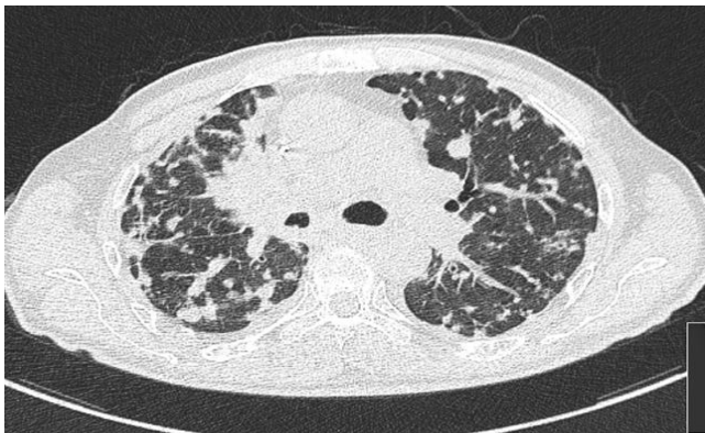
Şekil 2: Toraks BT'de bilateral yaygın nodüler lezyonlar.