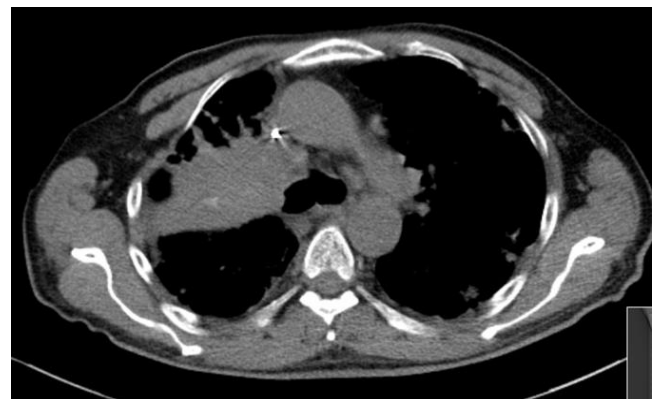
Şekil 3: Toraks BT'de sağ ana bronşa invaze kitle lezyon.