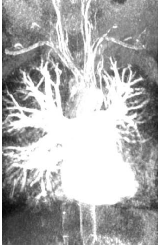
Şekil 4: Pulmoner MR Angiografi; sol hemitoraksta hacim kaybı ve sol pulmoner arter dallanmasında belirgin azalma.

Toksik duman inhalasyonu ve organ transplantasyonu da etyolojide rol oynayan diğer faktörlerdendir (5). Tekrarlayan pulmoner enfeksiyonlar, efor dispnesi, wheezing, öksürük, balgam çıkarma ve hemoptizi SJMS'in asıl semptomları olmakla birlikte az sayıda hasta asemptomatik kalabilir (6). Olgumuzda semptomlar 10 yıl öncesinde başlamış, tekrarlayan pnömoni ve bronşektazi nedeniyle araştırılmıştır. Bu olguların akciğer grafisinde tek taraflı hiperlüksens görünüm ile birlikte etkilenen bölgedeki pulmoner damarlanma azalmış olup, hilus normalden küçük saptanır. İnspiryumda mediasten etkilenen tarafa doğru kayar (7,8). Olgumuzun akciğer grafisinde sol hemitoraksta hacim kaybı ve yüksek çözünürlüklü bilgisayarlı to-