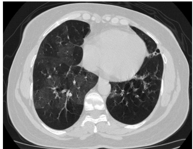
Şekil 2: YÇBT Parankim Penceresi; YÇBT'de hava hapsi alanları ve bronşektazik değişiklikler.

nırlarda izlendi. Akciğer hacimleri TLC: %92, RV: %140 ve RV/TLC: %51 saptandı. Yüksek çözünürlüklü bilgisayarlı tomografisinde (YÇBT) sol pulmoner arter ve dallarının kalibrasyonu sağa kıyasla belirgin azalmış, hiperlüsens akciğer görünümü vardı. Ayrıca solda daha belirgin olmak üzere bilateral alt loblarda bronşektazik genişlemeler ve beraberinde hava hapsi görüldü (Şekil 2). Akciğer perfüzyon sintigrafisi'nde sağ akciğer üst lob apikal ve posterior, alt lob süperior, lateral ve bazal segmentlerde; sol akciğer alt lob süperior, alt lob bazal ve süperior segmentlerde multiple alanda segmental-subsegmental perfüzyon defektleri izlenmiştir (Şekil 3).