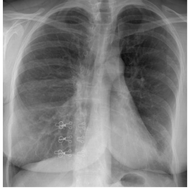
Şekil 1: PA akciğer grafisinde sol akciğerde hacim kaybı ve bronşektazi düşündürülen alanlar.

nırlarda izlendi. Akciğer hacimleri TLC: %92, RV: %140 ve RV/TLC: %51 saptandı. Yüksek çözünürlüklü bilgisayarlı tomografisinde (YÇBT) sol pulmoner arter ve dallarının kalibrasyonu sağa kıyasla belirgin azalmış, hiperlüsens akciğer görünümü vardı. Ayrıca solda daha belirgin olmak üzere bilateral alt loblarda bronşektazik genişlemeler ve beraberinde hava hapsi görüldü (Şekil 2). Akciğer perfüzyon sintigrafisi'nde sağ akciğer üst lob apikal ve posterior, alt lob süperior, lateral ve bazal segmentlerde; sol akciğer alt lob süperior, alt lob bazal ve süperior segmentlerde multiple alanda segmental-subsegmental perfüzyon defektleri izlenmiştir (Şekil 3).