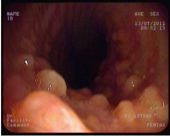
Şekil 3: Trakeanın bronkoskopik görünümü.