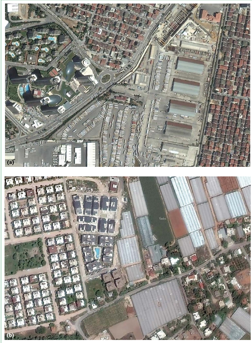
Şekil 3. (a) Kentsel parçaların birleşimi (Ataşehir, İstanbul). (b) Kentsel ve kırsal parçaların birleşimi (Muratpaşa, Antalya) (Yandex, 2019).

Ancak kent 'tuhaf' bir sorundur. Belirsiz, doğrusal olmayan ve karmaşık yapısı nedeniyle kentin tanımlanabilir bir başlangıcı, sonu veya çözümü yoktur (Iossifova vd. 2018). Kente ilişkin herhangi bir olay, durum veya sorun, bugüne kadar tanımladığımızdan farklı olarak yeni bir form ile ortaya çıkmaktadır. Bu geçmişten tamamen bağımsız da değildir. Bugün tutarlı bir bütünü oluşturan parçalar gelecekte birbirinden ayrılacak ve karşımıza yeni bir olay, durum veya sorun olarak çıkacaktır.