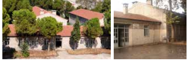
Şekil 2. Taş atölyeler.

Kentin gelişimine yön veren politikalar 2000lere gelindiğinde bir yandan neo-liberalizm ile sürekli gevşeyen bir planlama yaklaşımı, diğer yandan ise mekansal kararları merkezîyetçi bir tutumla yürüten bir yönetim modeli ile belirlenmektedir. Kentler piyasanın belirleyiciliğinin yanı sıra merkezi yönetimin