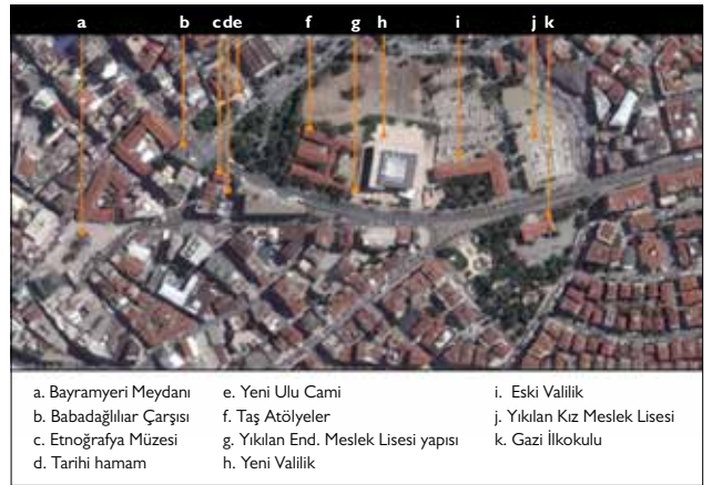
Şekil 5. Denizli tarihi ve erken cumhuriyet dönemi merkezi alanı günümüzdeki hali (Kaynak: Google haritalar, 2015).