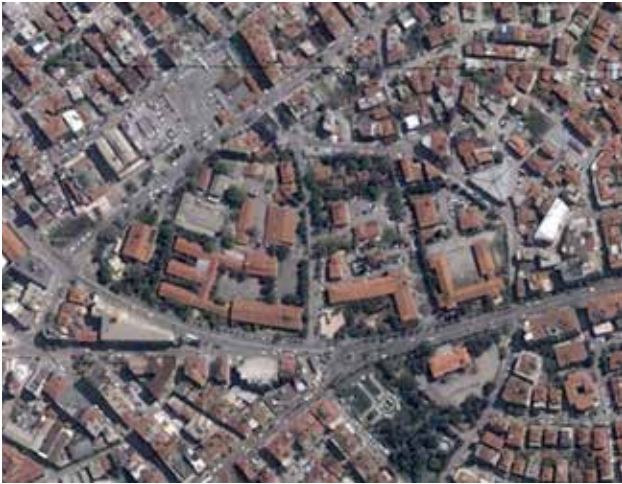
Şekil 3. Denizli kent merkezi, 1990’ların sonu.

Uygulama aşamasında ise birinci seçilen projeden önemli kopmalar görülmektedir (bakınız Şekil 4). Projenin hayata geçme sürecinde, korunması protokol ile güvence altına alınan ve projede yer verilen Vali Vefki Ertür Kız Meslek Lisesi 18 Haziran 2010 tarihinde yıkılmıştır. Protokole ve projenin korumasına rağmen, kız meslek lisesinin yıkımının önüne geçilememiş, alan günümüzde otopark haline gelmiştir. Kent meydanı projesi kapsamında taş binaların atölye olarak kullanıldığı Şehit Öğretmen Yusuf Batur Endüstri Meslek Lisesi’nin okul binası 2010 yılında yıkılmış ve projeye göre Yeni Valilik bu alanı da içerecek biçimde yerleşmiştir. Yarışmada birinci seçilen projenin diğer bölümlerinde de birebir uygulama yapılamamış, bulvarın yer altına alınması önerisi hayata geçememiş, bu şekilde kazanılacak alanda meydan yaratılamamış, yeşil bant kurgusu oluşturulamamıştır (Şekil 5).