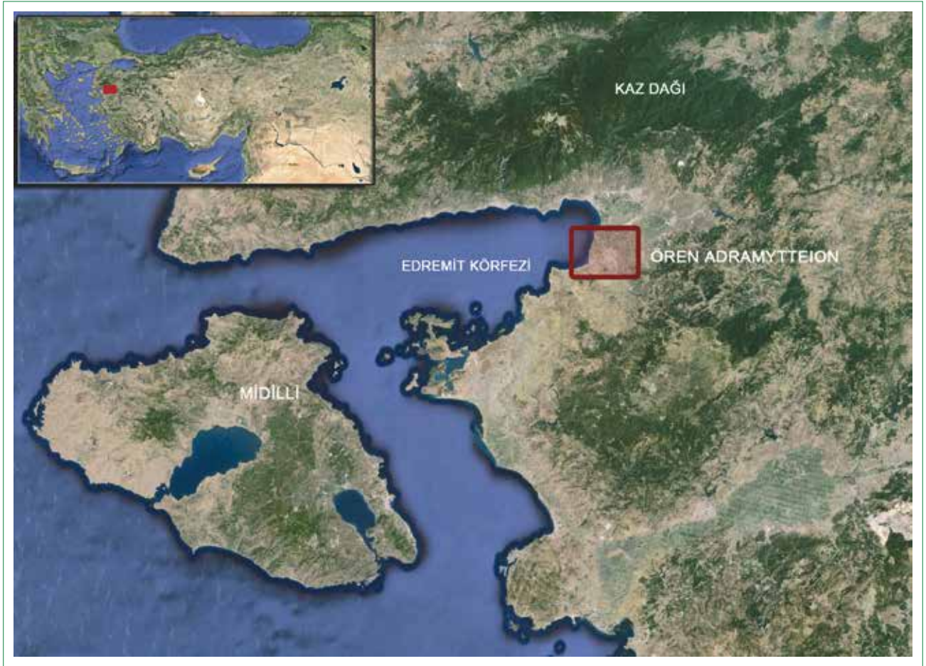
Şekil 1. Ören/Adramytteion Antik Kenti'nin konumu.

şehrinin bir mahallesidir (Şekil 1). Ören günümüzde çoğunlukla yazlıklardan oluşan bir sayfiye karakterine sahiptir.