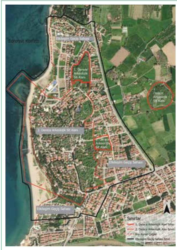
Şekil 4. Ören/Adramytteion Antik Kenti 1. ve 2. Derece Arkeolojik Sit Alanı ve etkileşim geçiş sahası sınırları.

Ayrıca 1960'ların başlarında da Ören sakinleri tarafından bu eserlerin toplanarak yörede bir müze talebinde bulunduğu ve dönemin mülki amirlerinin de yörede bulunan arkeolojik eserlerin sergileneceği bir müze kurulması konusunda vaatle buldukları döneme ait gazete haberlerinden izlenebilmektedir. 3 1973 tarihli 1710 sayılı Eski Eserler Kanunu'nun kabul edilmesinden iki yıl sonra 1975 yılında Ören Adramytteion antik kenti sit alanı olarak tescillenmiştir. Bu karar kapsamında Ören'de oluşturulan Tarihsel Sit Alanı bugünkü Arkeolojik Sit Alanı'ndan daha geniş şekilde, kabaca Ören Adramytteion Arkeolojik Sit Alanı Koruma Amaçlı İmar Planı onama sınırlarına yakın bir alanı kapsamaktadır. 1983 yılında 2863 sayılı Kültür ve Tabiat Varlıklarını Koruma Kanunu'nun yürürlüğe girmesini izleyen yıllarda sit alanının tekrar gündeme geldiği ve sit sınırlarının değiştirildiği görülmektedir. Adramytteion yerleşme alanı Bursa Kültür ve Tabiat Varlıkları Koruma Kurulu'nun