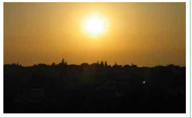
Şekil 10. Ören/Adramytteion Antik Kenti Arkeolojik Sit Alanı'nı silüeti (2. Yazar, 2012).

Şüphesiz bunlara Ören'in özgün ve yeşil dokuyla bütünleşmiş servilerin vurguladığı silüeti de eklenmelidir (Şekil 9, 10). Dolayısıyla, Ören'de korunması gerekli miras öğeleri çok katmanlı ve çeşitli bir yapı sergilemektedir. Ören'de plan kapsamında değerlendirilen ve mevcut hali ile korunması gereken miras öğeleri şu şekilde tanımlanmıştır: