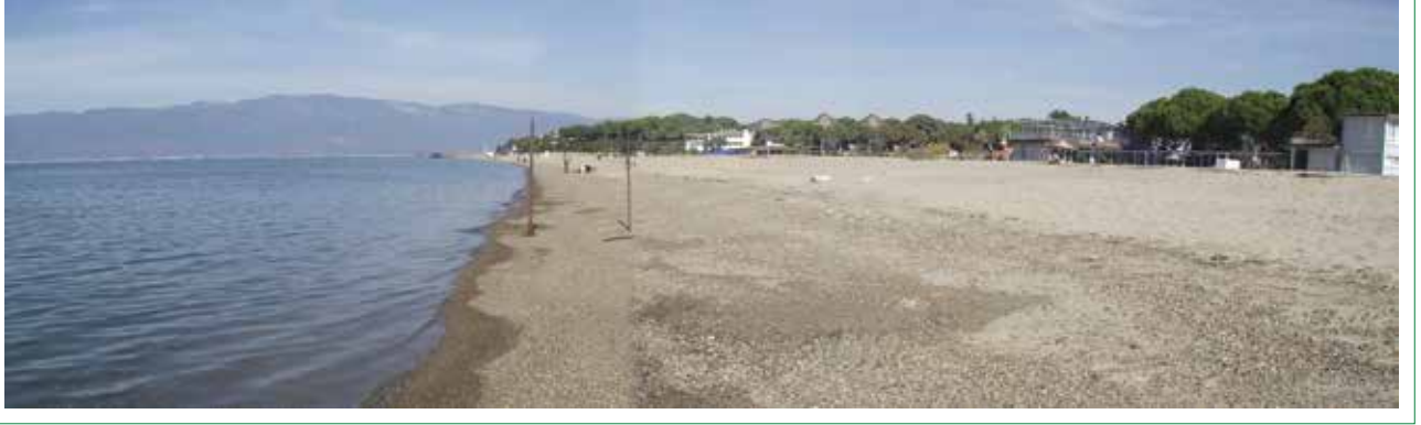
Şekil 8. Ören Kumsalı, güney yönünden bakış (2. Yazar, 2013).