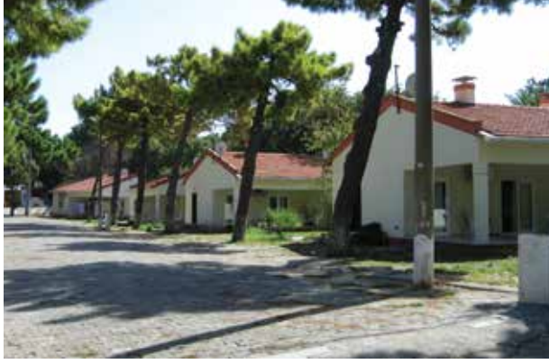
Şekil 6. Ören/Adramytteion Antik Kenti 2. Derece Arkeolojik Sit Alanı'nda bulunan 20. yüzyıl yapıları (2. Yazar, 2012, 2013).

taşınır varlıklar, diğer tür anıtlar ve bunların çevresi, ister toprakta ister su altında bulunsunlar, arkeolojik mirasa dahildirler.” (TBMM, 1999).