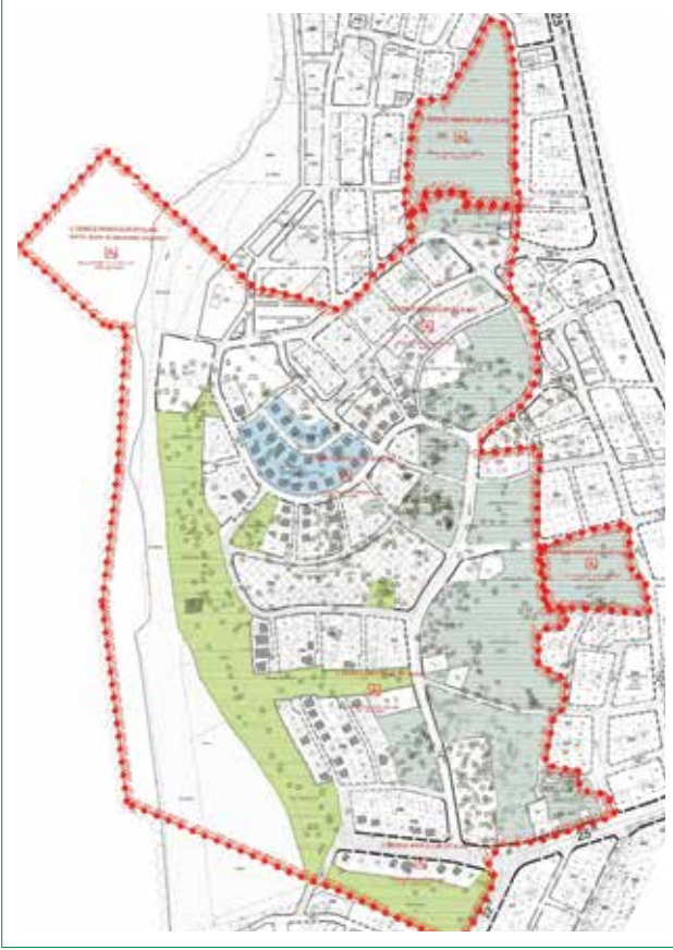
Şekil 11. Adramytteion Antik Kenti Arkeolojik Sit Alanı Koruma Amaçlı İmar Planı'ndan bir örnek, 2014. Bu plan örneğinde arkeolojik rezerv alanları (koyu yeşil boyalı alanlar), arkeopark alanı (açık yeşil boyalı alanlar), arkeoloji ve sanat atölyeleri (mavi boyalı alan), tescil önerisinde bulunan 20. yüzyıl yapıları (içi çapraz taralı yapılar) ve tescil önerisinde bulunan ağaçlar (yuvarlak semboller) yer almaktadır. Parsel numarasıyla gösterilen yapılar ise mevcut yapılar ile yıkıldığında yerine bir daha yapı yapılamayacak parselleri göstermektedir.

sit alanı koruma amaçlı imar planı hedeflerindedir. Bu hedef doğrultusunda antik kentin ve arkeolojik kazılarının yöreye kazandırdığı tarihsel ve arkeolojik kimliğe uygun ve uyumlu olarak Ören'e arkeoloji temelli ve temalı bir kamusal yeşil alan kazandırma fikri yani arkeolojik park önerisi uygun görülmüştür. Arkeopark, tarihsel değerler ve kent kullanıcılarının rekreasyonel faaliyetlerini karşılama unsurlarını taşıyan kültürel ve arkeolojik miras yönetimi ile kentsel rekreasyonel faaliyetlerin birlikte sunulduğu kent içinde yeni bir yorumlama merkezidir (Tuna ve Erdoğan, 2016). Ören /Adramytteion Arkeolojik Parkı, kazı alanlarını ve Ören kıyı aksını içerir (Şekil 11). Halihazırda Ören'de kıyı aksı boyunca uzanan yaya alanı hemen hemen tümüyle gezinti ve yeme-içme ihtiyaçlarına hitap etmektedir. Bu yanlış olmasa da arkeolojik açıdan böylesine kıymetli bir alan ve değerli konum için önemli eksiklikler içeren bir kullanımdır. Bu sebeple kıyı aksının koruma planında arkeopark alanı olarak kentsel tasarım projeleriyle düzenlenmesi öngörülmüştür.