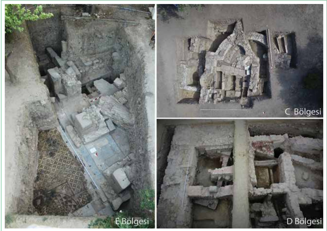
Şekil 3. Ören/Adramytteion Antik Kenti C, D ve E bölgesi kazı alanı.

çoğunlukla bahçeli sayfiye evlerinden oluşan düşük yoğunluklu bir yazlık yerleşme ortaya çıkmıştır. Bugünkü Ören yerleşmesi 1954–1960 yılları arasında Burhaniye’de kaymakamlık yapan Hüseyin Öğütçen öncülüğünde 1955–1960 arasında Burhaniye Belediye Başkanlığı yapmış olan Avni Meço işbirliği ile ortaya çıkmış ve biçimlenmiştir (2. Yazar, 2013a).