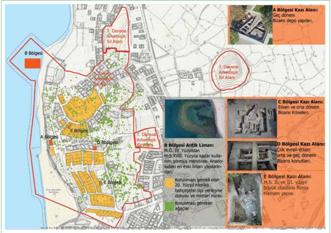
Şekil 5. Ören/Adramytteion Antik Kenti Arkeolojik Sit Alanı korunması gerekli miras öğelerinin harita üzerinde gösterimi.

binin birlikte çalışma imkanı makalenin temel sorusu olan korunması gerekli doğal ve kültür mirasının kapsam ve koruma yöntemi üzerinde birlikte karar vermeyi sağlamış ve uzun soluklu bir çalışma yürütülmüştür.