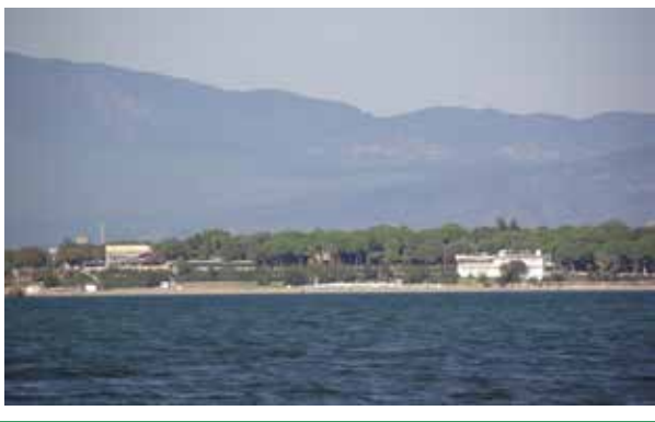
Şekil 9. Ören/Adramytteion Antik Kenti Arkeolojik Sit Alanı'nın denizden görünümü (2. Yazar, 2013).