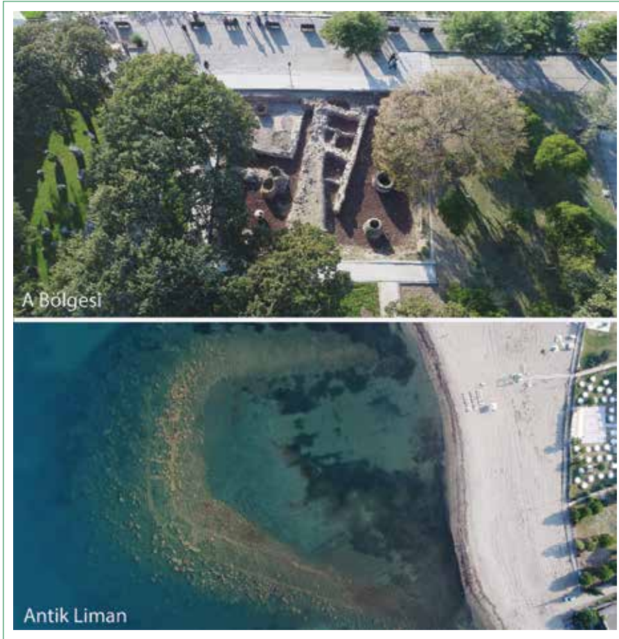
Şekil 2. Ören/Adramytteion Antik Kenti A bölgesi kazı alanı ve antik liman B bölgesi.

kısmen açığa çıkarılmıştır (Özgen, 2014). Alanda üst kotlarda Erken Bizans Dönemi malzemenin yoğunluk kazanması kronolojik olarak alanın kullanımında D bölgesi ile benzerlikler olduğunu göstermektedir. (Özgen, 2014). “E Yapısı” M.S. 2. ya da 3. Yy Roma Dönemi’nde olasılıkla hamam olan nitelikli bir kamu yapısına dair somut veriler sunmaktadır (Özgen, 2018).