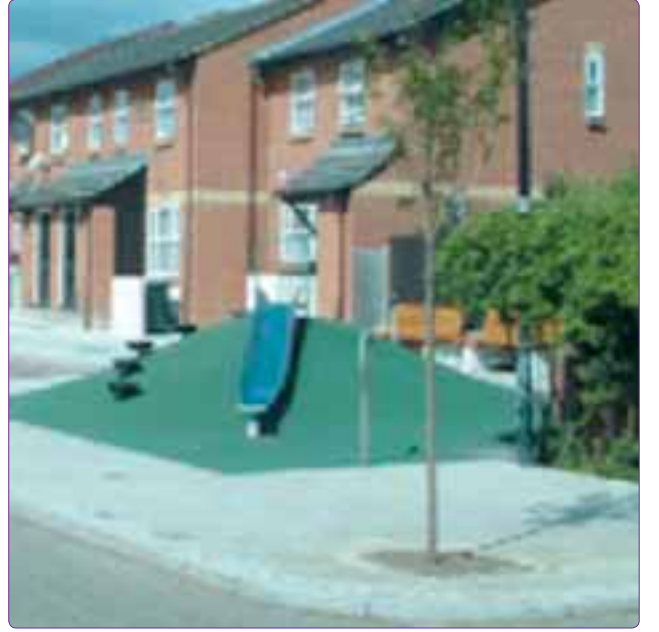
Şekil 10. “Home Zone” olarak düzenlenmiş bir sokakta oyun alanı (DFT, 2005).