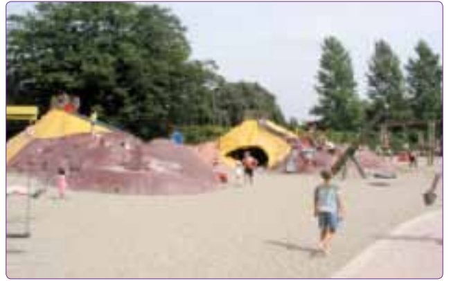
Şekil 20. Plantenun Blomen Park çocuk oyun alanında, macera oyun alanından bir görünüm (Hamburg) (Url-11).

Macera oyun alanları Danimarka'da 2. Dünya Savaşı sonrasında ortaya çıkmıştır. Çocukların bilgi, görgü ve deneyimlerini uygulamalar yoluyla artırmayı öngören, çocuğun bilişini zenginleştirmeyi hedefleyen bir öneridir. Çocukların bir şeyleri yapma-bozma yoluyla öğrenmekten zevk aldıkları inanacına dayalı olan bu görüş 1950'li yıllarda İngiltere'de, 1960'lı yıllarda İsviçre ve Almanya'da uygulanmaya başlanmıştır (Gür ve Zorlu, 2001).