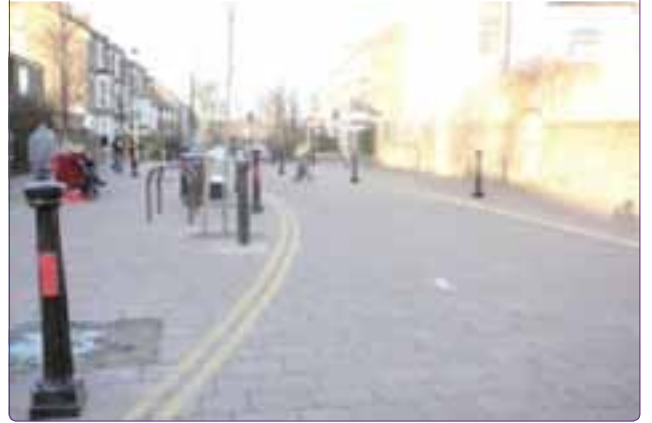
Şekil 7. İngiltere’den “Home Zone” örneği bir sokak (Londra, İngiltere). 1

mekânlar, sokaklar olarak tanımlanabilir. En önemlisi bu kamusal mekânlar insanları yürümeye, bisiklet kullanmaya teşvik edecek, oturanlar arasında iletişimi ve toplum aktivitelerini destekleyecek çeşitli donatılar ile tasarlanır (East Lothian Council, 2006). Bu düzenlemelerde de en önemli unsur mekânın yayalar için güvenli hale getirilmesi için taşıtlara getirilen hız sınırlamasıdır (Şekil 5, 6, 7).