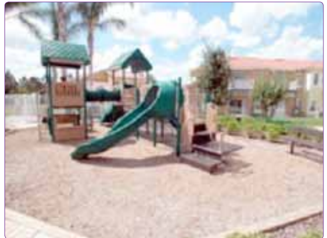
Şekil 17. Geleneksel çocuk oyun alanı (Url- 8).

Çağdaş Oyun Alanları, 1950-1960’lı yıllarda geleneksel çocuk oyun alanlarına alternatif olarak ortaya çıkan oyun elamanlarının alışılmamış form, doku ve renkte olduğu, estetik açıdan memnun edici oyun alanlarıdır (Aydemir ve diğ., 2004). Maliyetleri yüksek olduğundan sayıları azdır. Arazi form olarak hareketli, malzemeler ise statiktir. Su ve fiskiyeler, tırmanma tepeleri, tüneller, iple oluşturulmuş aktiviteler genel karakteri oluşturur (Ergen, 2000). Oyun elemanları beton, fiberglas ve ahşap malzemeden, canlı renklerde, kaplumbağa, balık, gemi vb.çekici biçimde ve heykelsidir (Aydemir ve diğ., 2004 ). Çağdaş oyun alanlarının amacı, yarattıkları or-