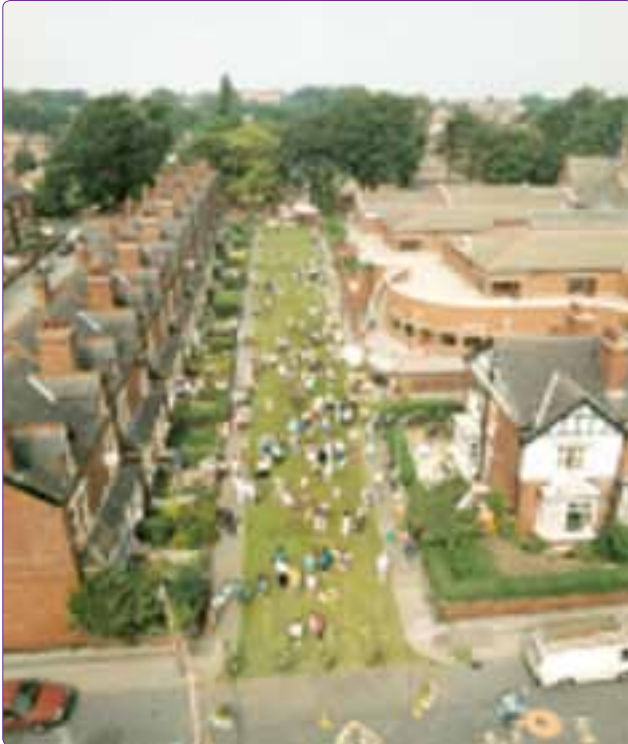
Şekil 6. Bir “Home Zone” örneği (Leeds, İngiltere ) (Url-3).