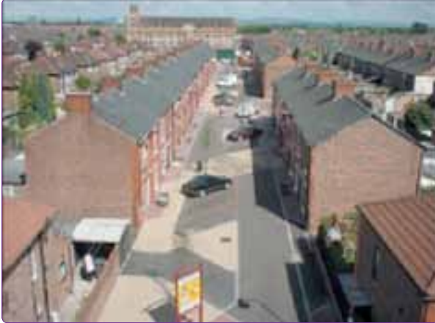
Şekil 5. İngiltere’deki ilk “Home Zone” örneği (Stainer Street, Northmoor, Manchester) (Joseph Rowntree Foundation, 2007).

İngilizce bir terim olan “Home Zone” terimi insan ve taşıtların eşit şartlar altında paylaştıkları kamusal