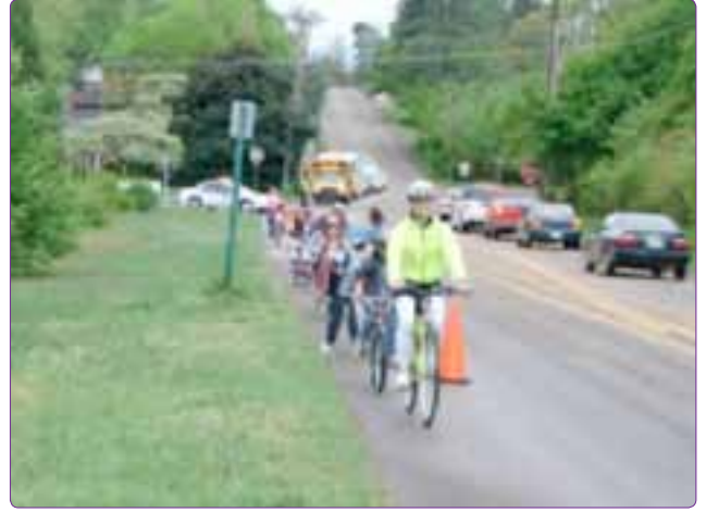
Şekil 13. Safe Routes to School (Hamilton County, UK) (Url-4).

Uygulama sonrası Odense'de 1980 yılında yapılan bir proje ile okul gidiş-gelişlerinde meydana gelen kazaların %82 azaldığı tespit edilmiştir (Osborne, 2005). 1985-2000 arasında 6-16 yaşında trafik kazalarında ölen ya da yaralanan çocukların sayısı ise %46 azalmıştır. Yaklaşık olarak bu azalmanın yarısı güveni yol ve bisiklet rotası geliştirmelere dayanmaktadır (Jenson ve Hummer, 2002).