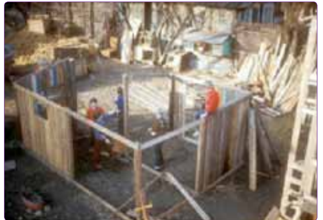
Şekil 21. Bir macera çocuk oyun alanı (Url-12).