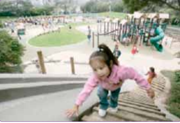
Şekil 18. Çağdaş bir çocuk oyun alanı (Url-9).