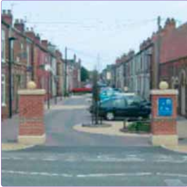
Şekil 8. “Home Zone” olarak düzenlenmiş sokağın giriş yeri (DFT, 2005).

“Home Zone” iyi tasarlanmışsa taşıtların maksimum sürüş hızı insanın yürüyüş hızından biraz daha hızlıdır (Joseph Rowntree Foundation, 2007). Taşıt sokağa girdiğinde yolun dokusunda, rengindeki değişiklikler ve sokağın girişinde tasarlanmış olan giriş kapısı, sürücünün yayaların önceliği olduğu bir alana girdiğini hissettirir (Şekil 6). Sokağın içindeki çeşitli unsurlar araçların hızını yavaşlatmasına, doğal olarak sürücülerin yayalar açısından güvenli şekilde sürmesine neden olur. Bu unsurlar hız kesiciler, dolambaçlı taşıt rotası,