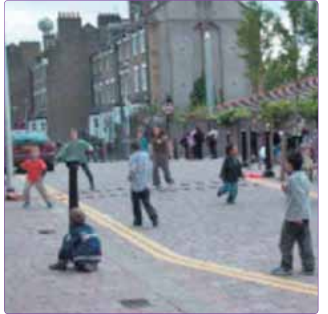
Şekil 11. “Home Zone” olarak düzenlenmiş sokakta sokak oyunları (DFT, 2005).

tuzaklar, yolda yapılan daraltmalar, ağaçlar/bitkiler, oturma mekânları, bisiklet park etme alanları, farklı kademelerde düzenlenmiş park alanları ya da çocuklar için yoyun ekipmanlarının olduğu oyun alanları olabilir (Bristol City Council, 2003) (Şekil 9, 10, 11).