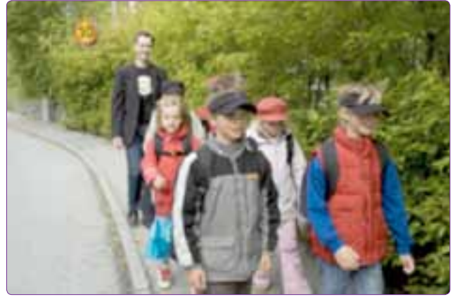
Şekil 16. Walk-Bus (Stockholm) (Url-7).

Geleneksel Çocuk Oyun Alanları, yetişkinler tarafından belirlenen bir takım kriterler doğrultusunda tasarlanan, kataloglardan seçilmiş standart malzemelerden ve genelde tek bir kullanıma cevap veren oyun aletlerinden oluşmaktadır (Chamberlin, 1998). Bu tip oyun alanları genel olarak çocukların sallanma, kayma gibi