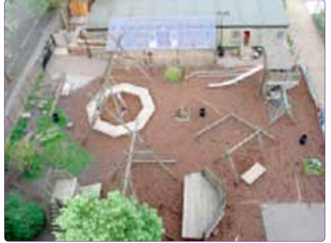
Şekil 19. İngiltere'den bir macera çocuk oyun alanı (Url-10).

tamlarla çocukların etkin oyunlarından başka, edilgen, düşsel, yaratıcı ve hatta bilişsel oyunlarına olanak tanı-maktır Çağdaş oyun alanları eğitim açısından, faydalı oyun formlarına olanak sağlar (Ergen, 2000) (Şekil 18).