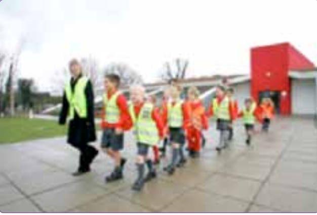
Şekil 14. Walking School Buses (Url-5).

otomobil kullanımının azalmasında bir çözüm olarak kabul edilmiştir. Ancak çocuklar arasında obezitenin artması, otomobil egemen komşuluklar ve artan okul taşıma ücretleri ile birlikte Amerika'da da Danimarka ve İngiltere'den "Safe Routes to Schools" modeli benimsenmiş, "California Safe Routes (Güvenli rotalar)" gibi programlar uygulanmaya başlanmıştır (Osborne, 2005).