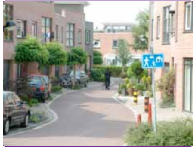
Şekil 1. Bir Woonerf örneği (Rijswijk, Hollanda) (Url-1).

“Woonerf” sistemine kentsel planlama ve tasarım açısından bakıldığında sistemin önemli bir tasarım kon-