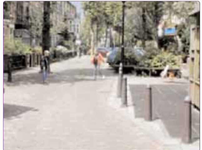
Şekil 2. Bir Woonerf örneği (Hollanda) (Url-2).