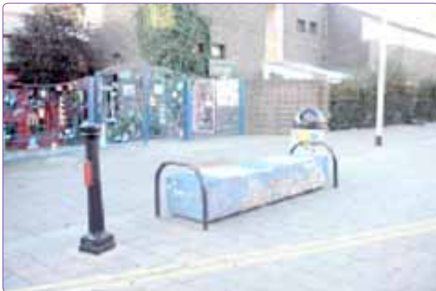
Şekil 9. “Home Zone” olarak düzenlenmiş bir sokaktaki kent mobilyaları (Londra, İngiltere).