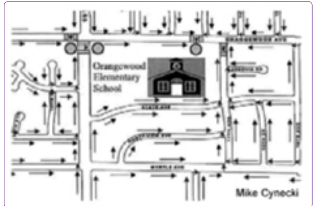
Şekil 15. Okula güvenli rotalar haritası (Osborne, 2005).

Okula güvenli rotaların oluşturulması İsveç, Stockholm'de de önem kazanmıştır. 2003 yılında başlatılan bir çalışma ile özellikle ailelere farklı ulaşım araçlarının olduğunu göstermek ve çocukların daha sağlıklı olmasını ve okul yakın çevresinde ise daha güvenli trafik yaratmak için bu araçların kullanımını sağlamak amaçlanmıştır. Bu proje ile seyahat davranış biçimlerini değiştirecek teknikler geliştirilmiştir. Aileler ve öğretmenler çocukların okul ve ev arasında yürüme, bisiklet kullanmaları ya da gruplar halinde seyahat etmelerini cesaretlendirmeleri için teşvik edilmiştir. Böylece okul ve ev arasındaki daha güvenli, eğlence açısından daha zengin, daha oyun dostu rotaların oluşturulması amaçlanmıştır. Uzun vadeli amaç ise araç trafiğinin neden olduğu problemlere insanların farkındalıklarını artırmak ve ulaşım için farklı araç ve yöntemlerin kullanılmasını sağlamaktır. Bu amaçla "Walk-Buses" hakkında bir film yapılmış, broşürler çeşitli materyaller basılmıştır. Ayrıca farklı ulaşım şekillerini gösteren bir poster, güvenli okul rotaları için bir kontrol listesi ve ilçe yöneticileri, pedogog, ebeveynler ve öğrenciler ile birlikte bir eylem planı hazırlanmış, çocuklarını okula otomobil ile getiren aileler için çocuklarını indirme noktalarını gösteren bir harita yapılmıştır. Bu proje vasıtasıyla çocukların ulaşım alışkanlıklarının nasıl değiştiği konusunda en iyi kanıt Stocholm'de "Walk Buses" ların iki yıllık period içinde %500'den fazla oranda