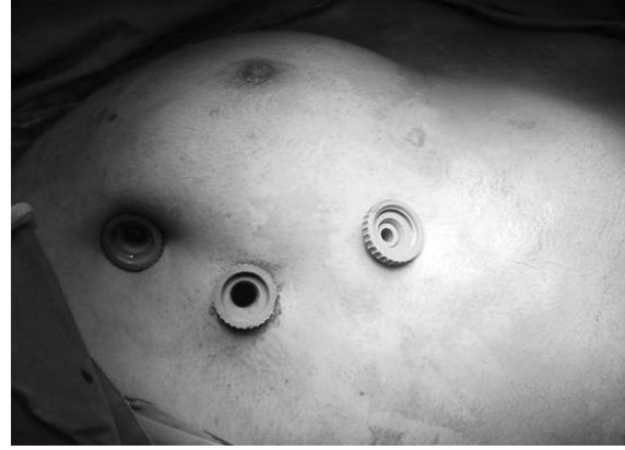
Resim 1. Hastaya verilen pozisyon ve torakoportların yerleştirilmesi

Hastalara eğer postoperatif bakım için yoğun bakım ünitesinde yatak rezervasyonu planlanmadıysa operasyon günün ilk vakası