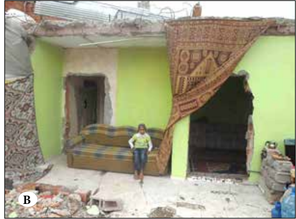
Şekil 10A ve 10B. Önder Mahallesi’nden ve bir başka bölgeden konut dışı mekân kullanımına dair örnekler.

Kaynaklar: 10A. Fotoğraf: Dilşa Günaydın Temel, Mayıs 2018; 10B. Suriyeliler, Harabe evleri, 2013.