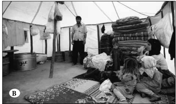
Şekil 11A ve 11B. Suriye çöllerinden Bedevi çadırı örnekleri.