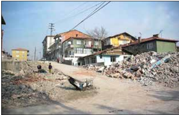
Şekil 4. Önder Mahallesi’nden bir görünüş.