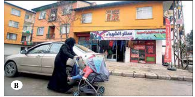
Şekil 5A ve 5B. Önder Mahallesi'nden sokak görüntüleri.