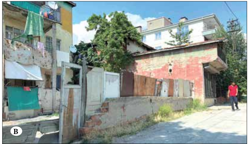
Şekil 13A ve 13B. Önder Mahallesi’nde konut dışı mekân kullanım çözümleri. Fotoğraf: Dilşa Günaydın Temel, Mayıs 2018.