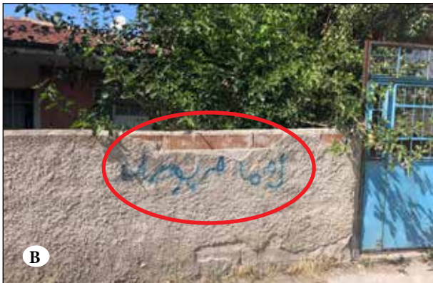
Şekil 7A ve 7B. Önder Mahallesi ev girişlerine elle yapılmış işaretlemeler.

Fotoğraf: Dilşa Günaydın Temel, Haziran 2019.