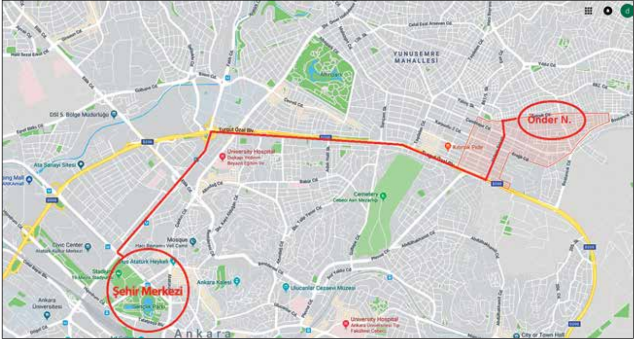
Şekil 3. Önder Mahallesi yakın çevre haritası, 2019.