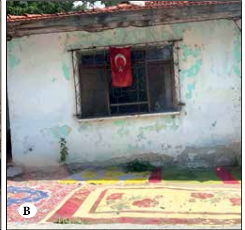
Şekil 12A ve 12B. Suriye ve Önder Mahallesi’nden konut dışı mekân kullanım örnekleri.