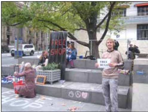
Şekil 1. Kamusal alanda kurulmuş bir satış alanı.

Suriyeli sığınmacıların Türkiye’de kalacağı kenti belirlemesinde, tanıdıklarının referansları ve bu tanıdıklarının yaşadıkları bölgede onlarla birlikte yaşama isteği etkili olmaktadır. Bu durum sığınmacının gittiği yerde kendini (örneğin finansal anlamda) daha rahat ve güvende hissetmek istemesinin doğal sonucudur (İçduygu, 2015). Bununla birlikte, yer seçimi için alanın çalışma olanaklarına yakın olması, kent merkezine kolay ulaşılabilir olması, ekonomik açıdan bölgedeki yaşam koşullarının zorlayıcı olmaması gibi faktörlerin önemli olduğu bilinmektedir (Salama, Wiedmann ve İbrahim, 2018). Vaka çalışmasının gerçekleştiği Önder Mahallesi’nde yaşayan Suriyeliler için de benzer durumlar söz konusudur. Önder Mahallesi ekonomik sebepler ve sosyal ilişkiler sebebi ile Suriyelilerin Ankara ilinde yerleştikleri ve