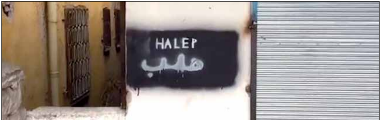
Şekil 6. Önder Mahallesi'nden elle yapılmış bir işaretleme.