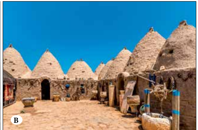
Şekil 15A ve 15B. Suriye geleneksel konut alanlarından konuta bağlı dış mekân kullanım örnekleri.