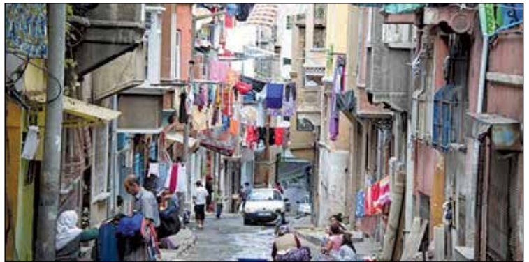
Şekil 2. İki bina arasında ip çekilerek oluşturulmuş çamaşır kurutma alanları.