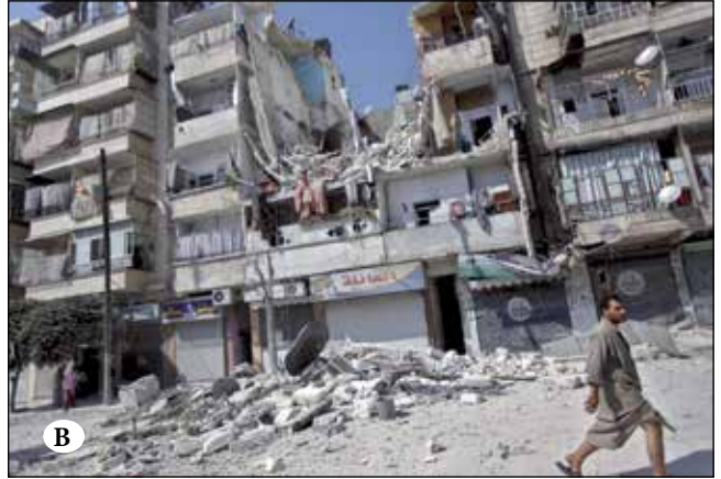
Şekil 14A ve 14B. Suriye güncel konut alanlarından konuta bağlı dış mekân kullanım örnekleri.

Kaynaklar: 14A. Suggestions for Designing, 2014; 14B. Syria fighting deeply, 2012.