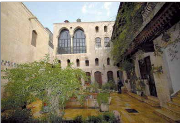
Şekil 9. Halep’te bir evin avlusu.

Konut önünde kilim ve halı kullanımı Suriye’de olduğu gibi Önder Mahallesi’nde de çok yaygındır (Şekil 12A ve 12B). Bu kullanım, her iki örnekte de çocukların evin önünde rahatlıkla oyun oynamasına, ailece ve komşularla toplanmaya ve hatta evi güzelleştirmeye kadar çok çeşitli işlevlere imkân vermektedir. İmkânlar ne olursa olsun halı ve kilim ögesinin kültürün bir mekânsal yansıması olarak Önder Mahallesi konutlarının önünü bezemesi ilginçtir. Bu bezeme için kullanılan halı ya da kilimler satın alınan ürünler değildir. Daha çok Suriyeliler’e yerel halk ya da yardım kuruluşlarınca bedelsiz verilen, bağlı-