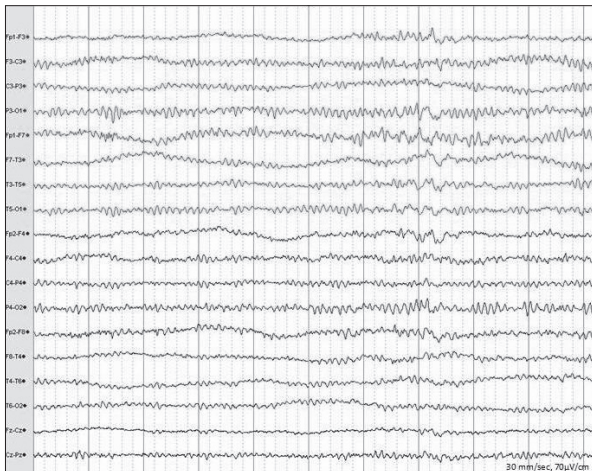
Şekil 1. Sol fronto-temporal yavaş (teta) aktivitenin karşı hemisfer homolog alanlara da yayıldığı izlenmektedir.

sında VPA düzeyi 74 mcg/ml saptanmış diğer tüm değerleri normal aralıkta bulunmuştur.