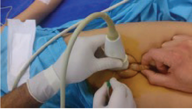
Şekil 1. Kusg probunun yerleşimi.